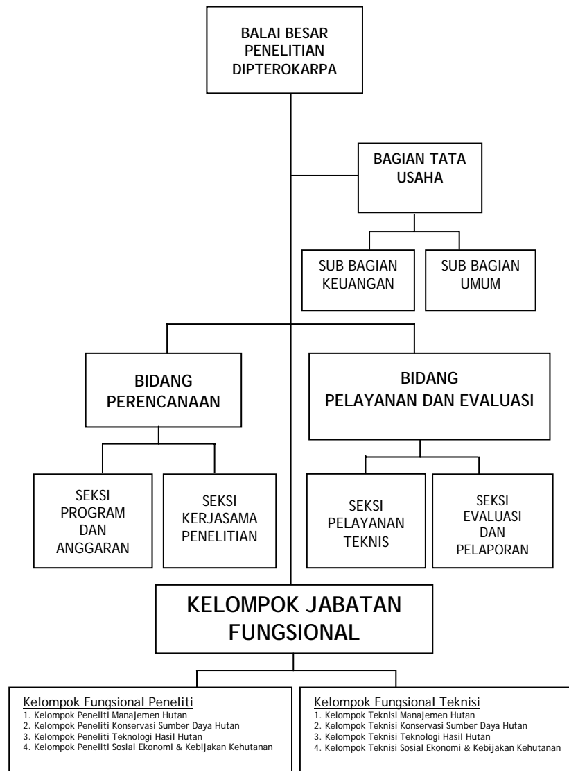
Gambar 1. Struktur Organisasi Balai Besar Penelitian Dipterokarpa