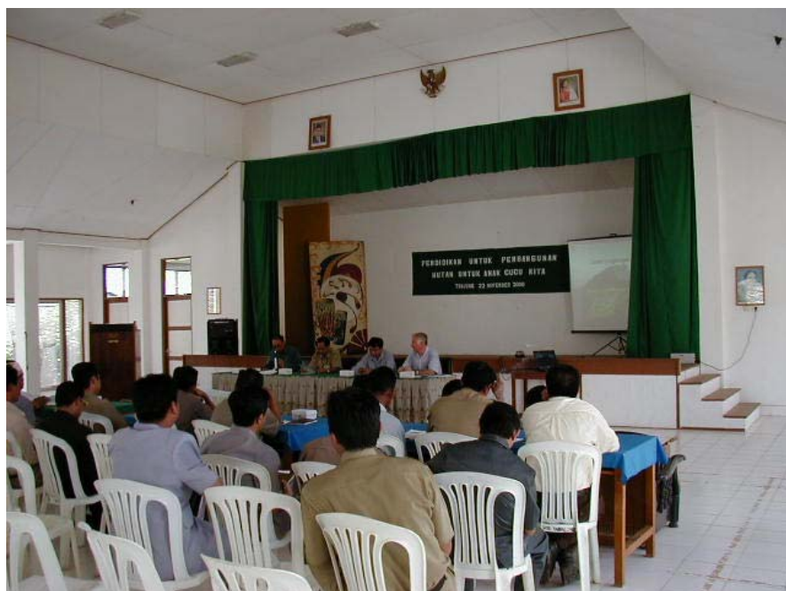
Gambar 1. Lokakarya integrasi pendidikan pelestarian hutan ke dalam kurikulum muatan lokal

Setelah berembuk dengan Dikbud Tabalong tentang proses pelaksanaan usulan tersebut, kemudian mereka menyarankan untuk merumuskan program serinci mungkin.