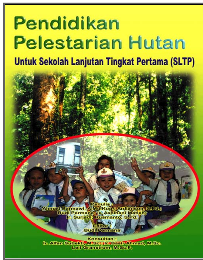
Gambar 2. Sampul depan buku pegangan siswa, program pendidikan pelestarian hutan bagi siswa SLTP

Pada tanggal 14-16 Agustus 200, Dikbud Tabalong dan SCKPFP telah melaksanakan lokakarya untuk menelaah isi dari buku pegangan dan menentukan silabus dan waktu pengajaran bagi para guru-guru. Beberapa penyempurnaan terhadap buku pegangan seperti penyisipan gambar dan pertanyaan untuk bahan latihan harus pula dilakukan.